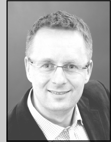
Bürgermeister Ewald Tschanz

Nach etwas mehr als einem Jahr Bauzeit öffnet der neue Bauhof der Gemeinde Gaschurn am 13. Dezember 2013 erstmals seine Tore.