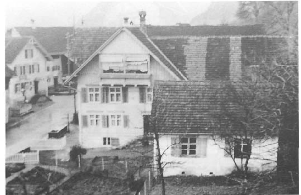
Instrumentomachars Hus im Strohdorf. Davor die alte Werkstatt, links Frickoneschars, Molars und Steonnowiorts Ottonos Hus.