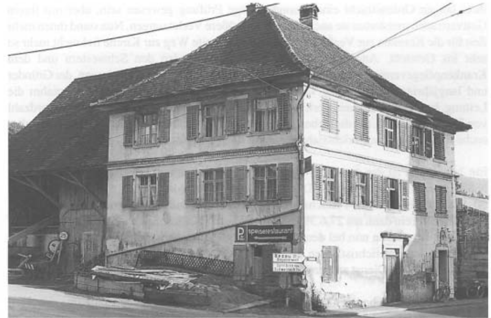
Die Post kurz vor dem Abbruch 1965. Von 1928 bis 1963 wohnten im zweiten Stock die Krankenschwestern.

Alle die weiten Wege durch das langgezogene Wolfurt machten die Schwestern damals zu Fuß. Aber auch in ihrem bescheidenen Heim in der Post stellten sich jeden Tag Kranke und Verletzte an. Für ein Vergelt's Gott ließ man sich dort Verbände wechseln, eitrige Wunden mit Kamillentee baden oder eine Ziehsalbe auf einen heißen Abszeß auflegen. Und immer