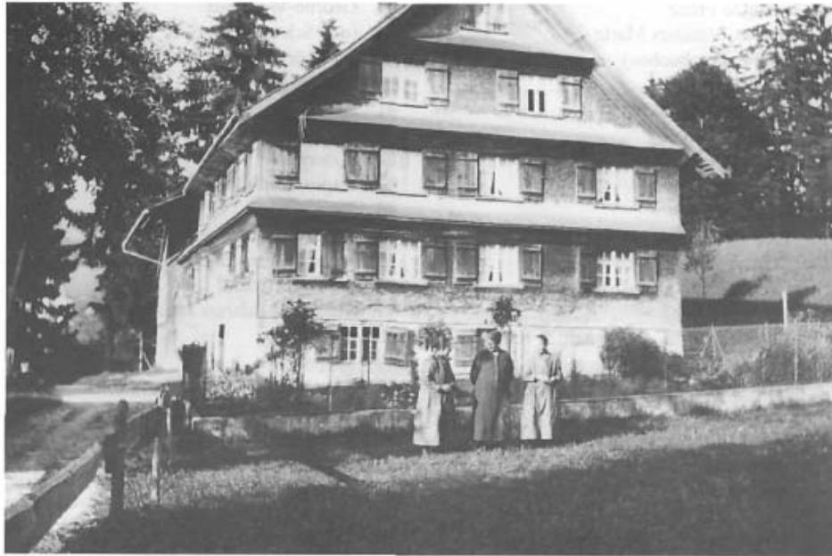
Beorgarhus im Oberfeld. Baltus Böhler vom Berg (Bildstein) hat es 1843 erbaut, 1944 ist es abgebrannt.