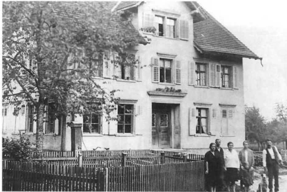
Lutz-Ferdes Hus wurde 1884 aus dem abgebrochenen Pfarrhof erstellt. Heute Muxels, Brühlstraße 30.