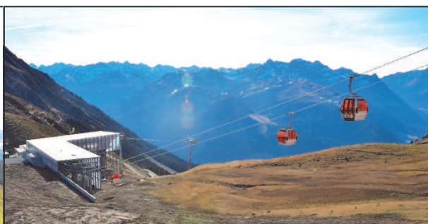
Bergstation Grasjoch/Talstation Hochalpila