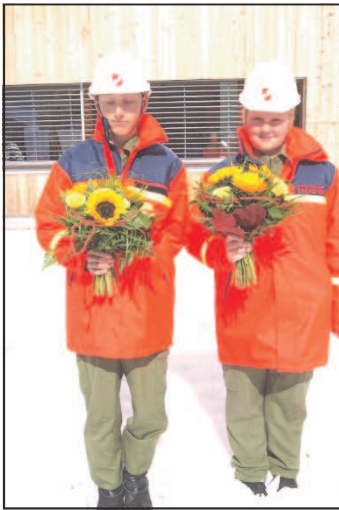
Eröffnung Wohnbau Partenen