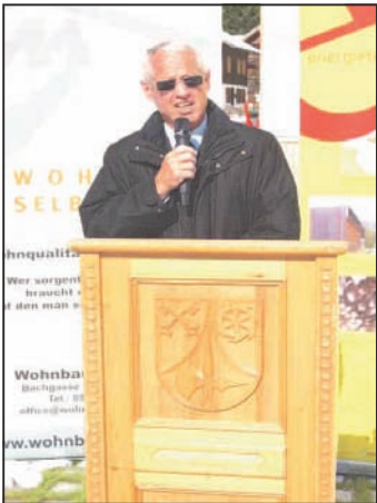
Eröffnung Wohnbau Partenen