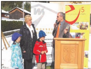
Eröffnung Wohnbau Partenen