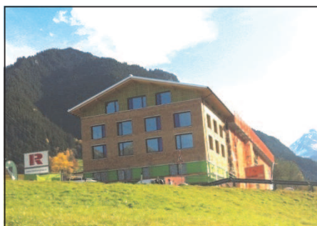
Explorer Hotel Montafon