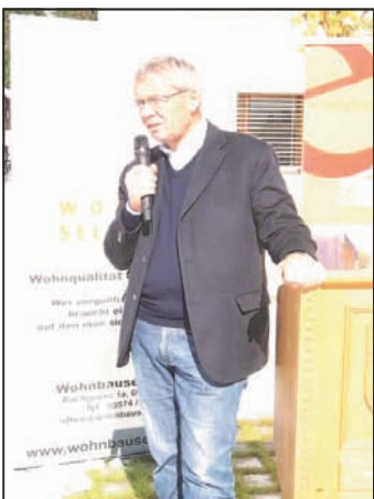
Eröffnung Wohnbau Partenen