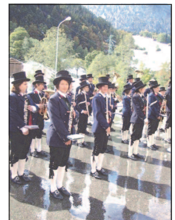
Eröffnung Wohnbau Partenen