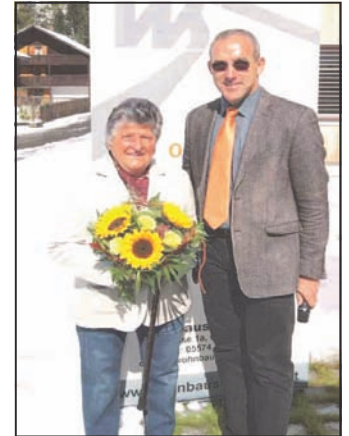
Eröffnung Wohnbau Partenen

Aktuell können Interessierte den e5-Lampenkoffer im Gemeindeamt ausleihen und sich über verschiedene Leuchtmittel ein Bild machen.