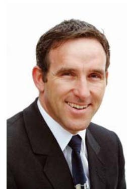
Bürgermeister Martin Netzer

Dank der Zustimmung der betroffenen Grundeigentümer wird derzeit der Weg zwischen Forststraße Kilknerwald und Bühel verbreitert, um den Weg leichter begehbar zu machen, aber auch, um im Winter einen ansprechenden Winterwanderweg anbieten zu können.