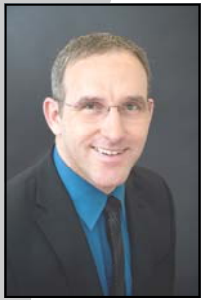
Bürgermeister Martin Netzer MSc

Wir sind überzeugt, dass es sich um ein gelungenes Projekt handelt, das auch die Belange der Nachbarn bestmöglichst berücksichtigt.