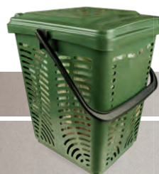
Sammeleimer (10 Liter)

Dieser Eimer ist im Gemeindeamt um € 20,- erhältlich und kann mit den Bio-Stärkesäcken zur Entleerung an die Straße gestellt werden.