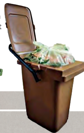
Depotbehälter (25 Liter)